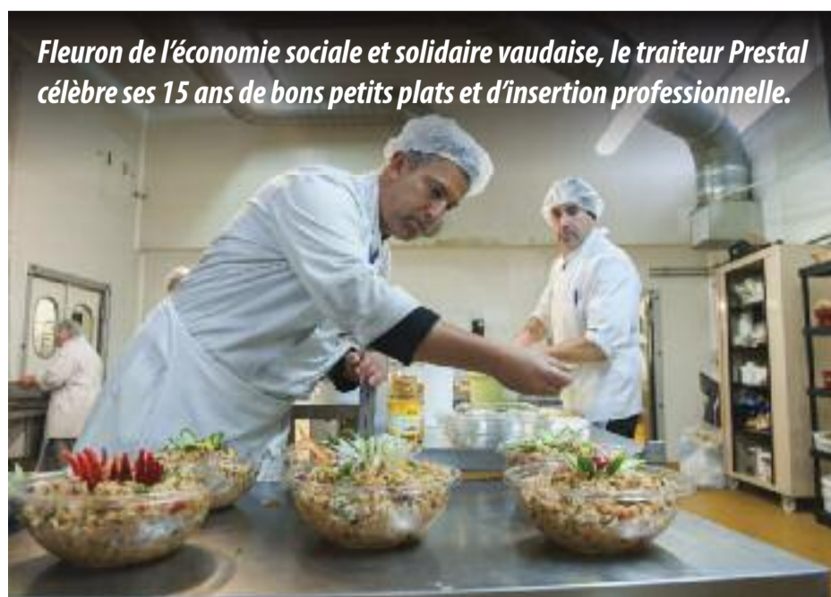
Fleuron de l'économie sociale et solidaire vaudaise, le traiteur Prestal célèbre ses 15 ans de bons petits plats et d'insertion professionnelle.

"L'objectif est qu'au bout de leurs contrats de deux ans, ils trouvent un emploi durable, explique la fondatrice. C'est une très grosse responsabilité pour nous, mais c'est la preuve que l'on peut être rentable et être parmi les plus gros traiteurs de la région, tout en misant sur l'humain et le social".